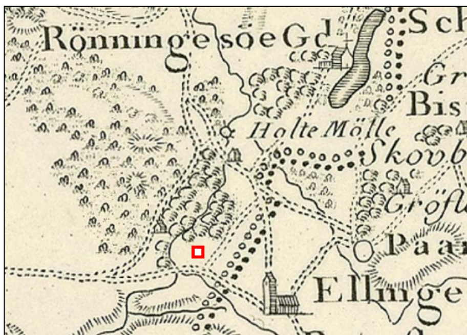
Videnskabernes Selskabs kort fra 1780