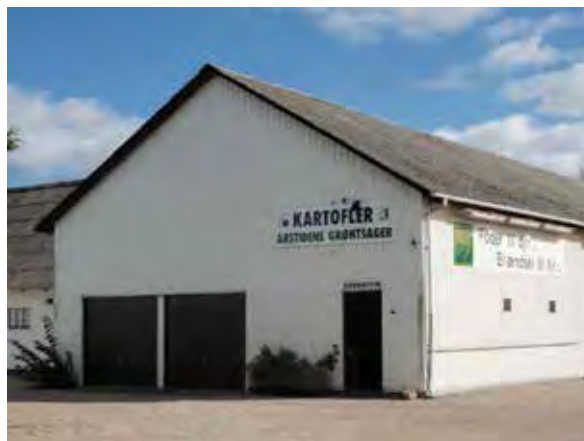
• Skiltning på landbrugsbygning i det åbne land