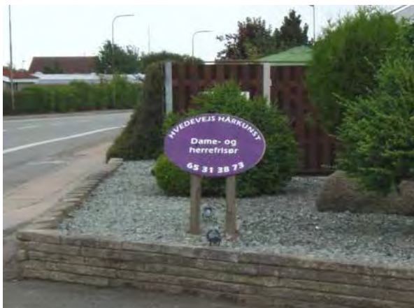
• Skiltning ved virksomhed i boligområde

Skiltning må ikke være sammenhængende over hele facadens længde.