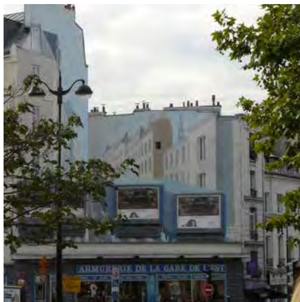
• Eksempel på kombination af gavlmaleri og billboards fra Paris